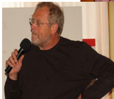
Wat is een feest in het Oude Westen zonder lied