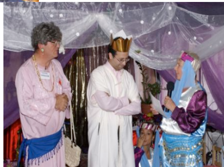
De verrassing van de avond, een heuse buikdanseres. Ze deed het prachtig.