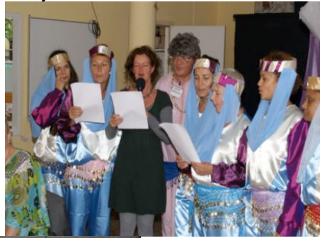
Kreuk en een heus koortje.