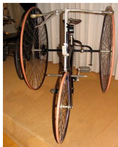
Dit is pas echt een oude fiets.