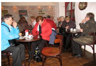
Een excursie begint nooit zonder eerst koffie gedronken te hebben.

Op 6 mei was het weer zo ver. De senioren uit het centrum gingen op excursie. Dit keer ging de reis naar Nijmegen om het fietsmuseum te bezoeken en naar Heumen, daar is een grote imkerij. Het was een leuke en leerzame dag en iedereen heeft er van genoten.