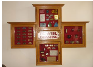
De echte ouderen onder ons zullen zich de rijwielbelasting plaatjes herinneren.