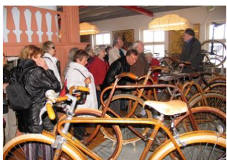
We kregen uitleg van een man die heel veel van de fietsen wist en daar vol vuur over wist te vertellen.