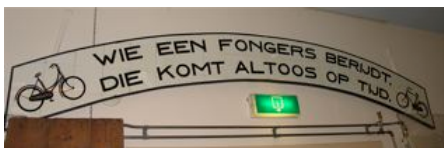
Verkopen ze nog Fongers fietsen?