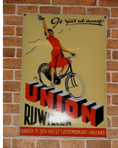
Dit soort borden zag je vroeger bij de rijwielhandelaar.