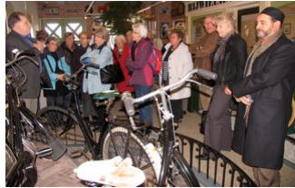
Hier staan we bij de "Koninklijke" fietsen.