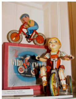
Het speelgoed met fietsen mag natuurlijk niet ontbreken.