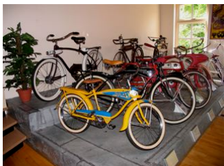
De wat "modernere" fiets.