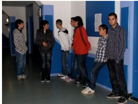
en de mannelijke jongeren blijven op de achtergrond