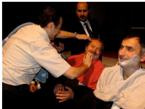
wat is de naam van dit spel, wie het weet mag het zeggen