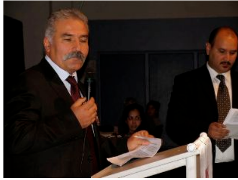
deze heren praten het programma aan elkaar