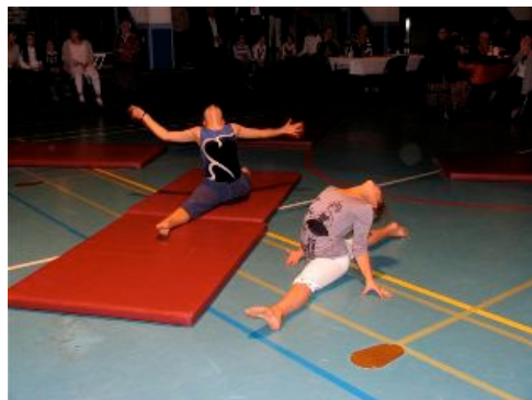
doe dat maar na