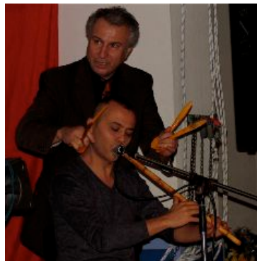
nog meer muziek