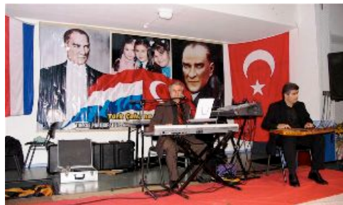
de mensen worden verwelkomd met muziek