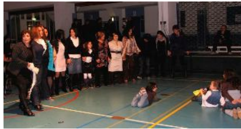
op een Turks feest wordt gevoldsdanst