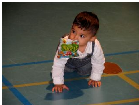
voor de kleinsten is er ook plek