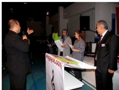
en de hoofdprijs is.....en fiets