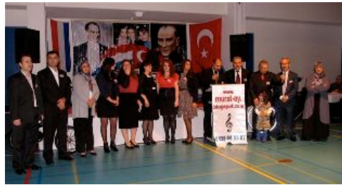
de organisatoren van het Turks participatie platform