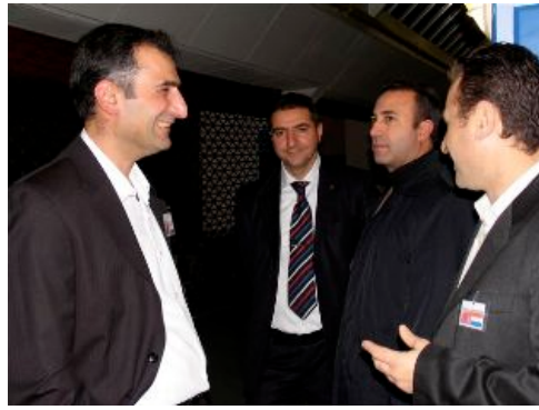
de heren staan aan de kant