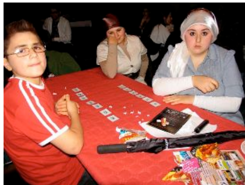
klaar voor de loterij