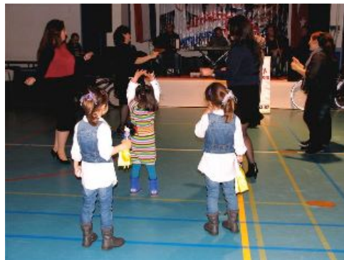
de dames bezetten de dansvloer