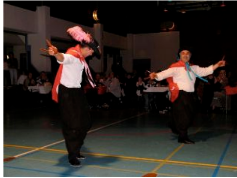
een traditionele dans