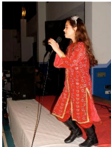
ook wordt er gezongen