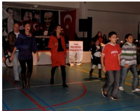
het spel met het ei op de lepel en lopen maar