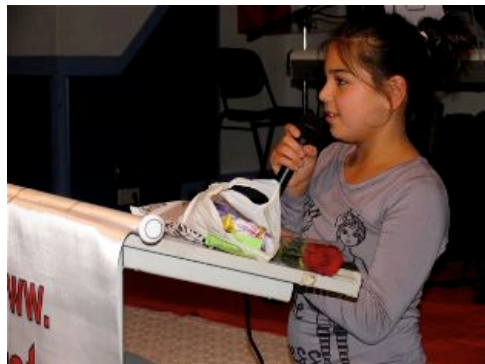
kind van de turkse les draagt een gedicht voor